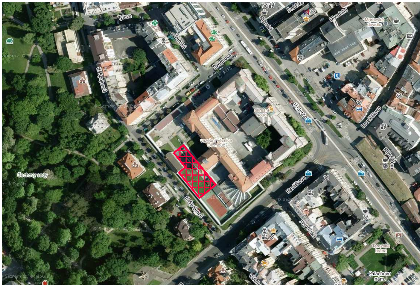
mapový podklad