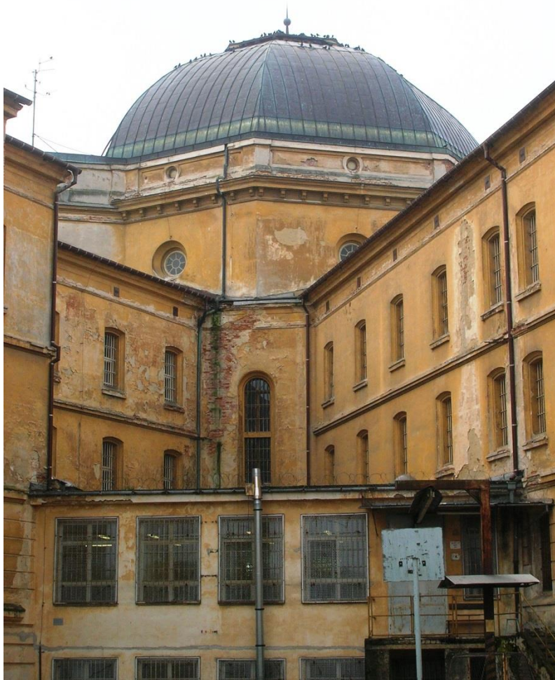
výseč mezi přisazenými objekty ( 2 příklady)